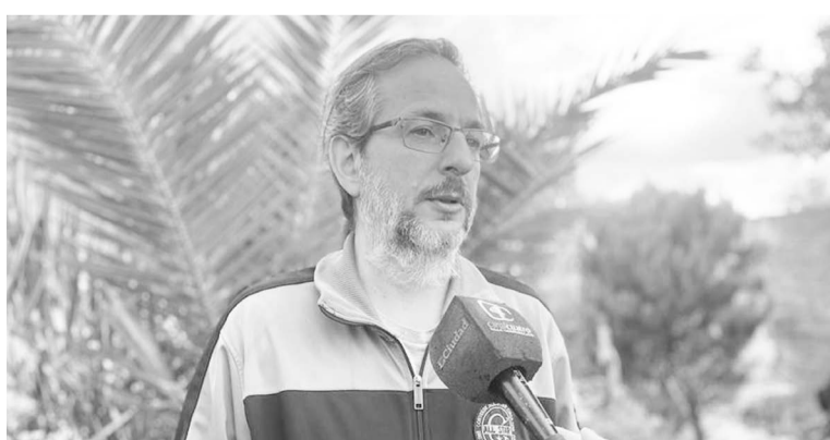
“Lo que ocurrió es un llamado de atención muy poderoso”, sostuvo Parrilla.

La participación de Parrilla y Vergara no quedó solo en el papel, ya que las obras fueron adaptadas para ser estampadas en remeras, permitiendo que el mensaje de la historieta circule de manera itinerante por diferentes espacios y manifestaciones. “Con esta po-