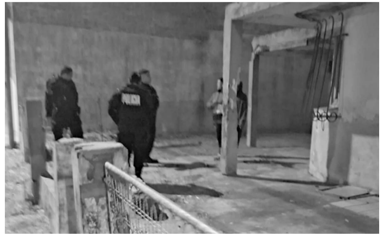
Personal policial respondió rápidamente al llamado al 911.

Los policías trasladaron a la mujer a la base del Comando Radioeléctrico en calidad de demorada. Allí se constató el requerimiento judicial activo que pesaba sobre ella.