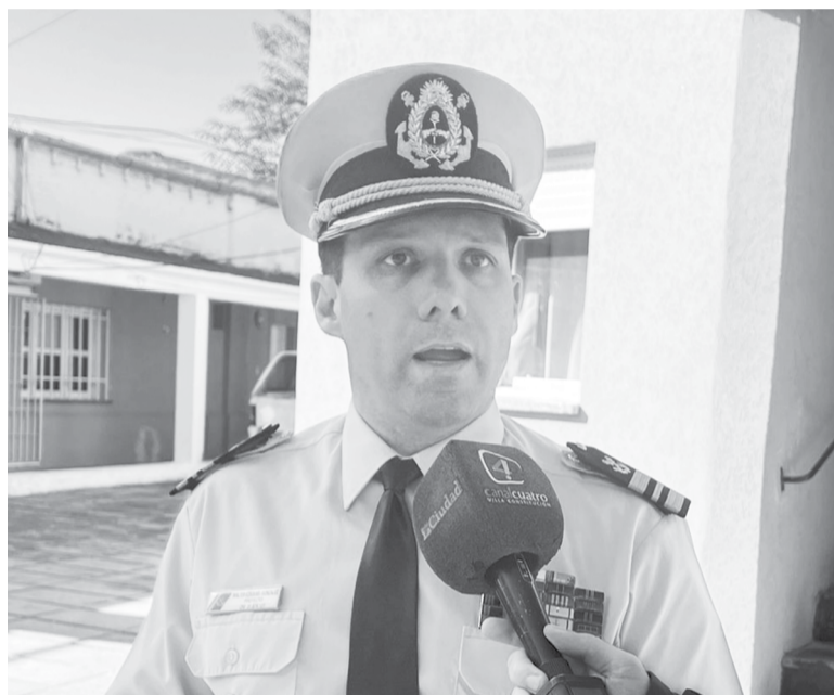
González explicó los requisitos para quienes deseen inscribirse.

Finalmente, aportó precisiones sobre las características de la formación para aquellos postulantes