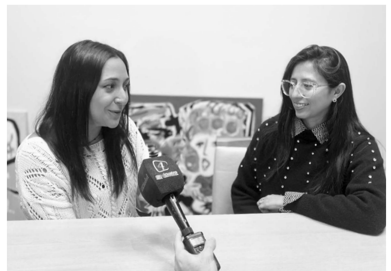
Las organizadoras brindaron detalles sobre la propuesta interactiva.

La organización del taller alternativo confirmó que los cupos