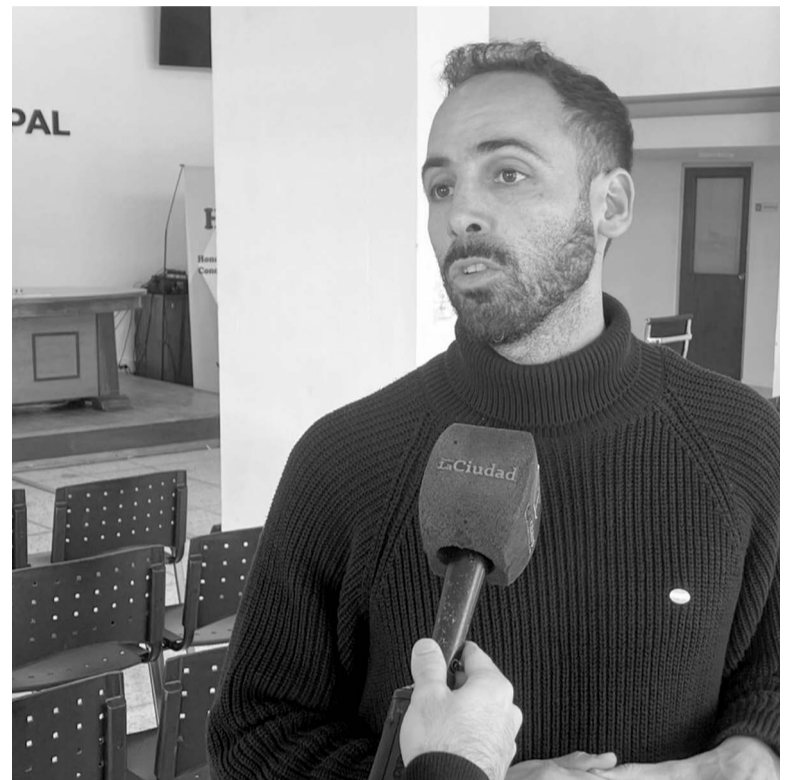
“El intendente ya no tiene más excusas”, sostuvo el concejal.