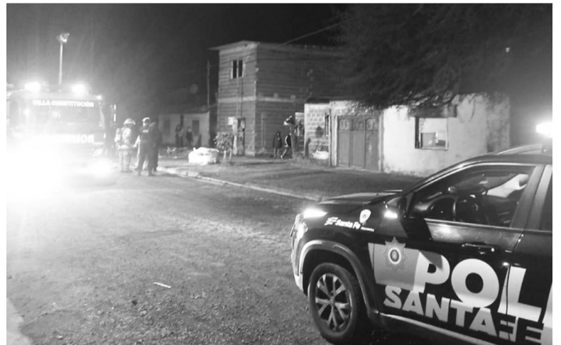
El segundo hecho se registró en una vivienda particular en la noche del domingo.

El morador detalló que un desperfecto eléctrico generó un cortocircuito en el tomacorriente donde