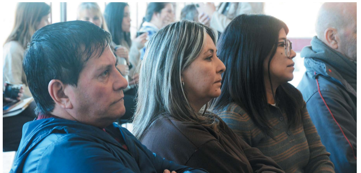
Las autoridades del área durante el encuentro en el legislativo local.

Desde la gestión del intendente Jorge Berti se reafirmó el compromiso municipal con la defensa de los derechos de jubiladas y jubilados, entendiendo que el reconocimiento a una vida de trabajo y esfuerzo debe traducirse en condiciones dignas, inclusión y acompañamiento real.