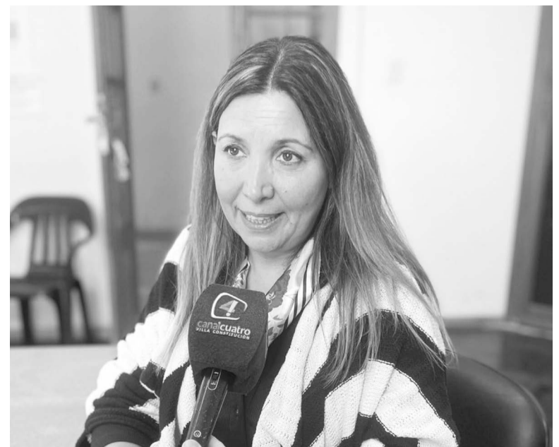
Brindó herramientas para el abordaje de la violencia en contextos educativos.

Para finalizar, se instó a los directivos a posicionar a la escuela como un lugar de referencia ante