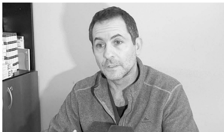
Cesario disertará el 28 de mayo en el Congreso de la Federación Argentina de Cardiología.

“Todo factor de riesgo necesita convivir en el cuerpo durante un