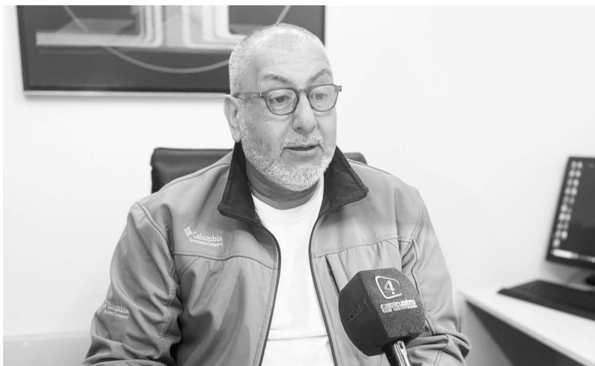
“Si uno sabe las reglas, solamente tiene que cumplirlas”, sostuvo el funcionario.

Para finalizar, el director insistió en que la cantidad de operati-