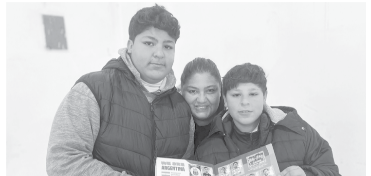
Los hermanos completaron las 994 figuritas.

Los pequeños coleccionistas compartieron la felicidad de haber finalizado el desafío en apenas 16 días.