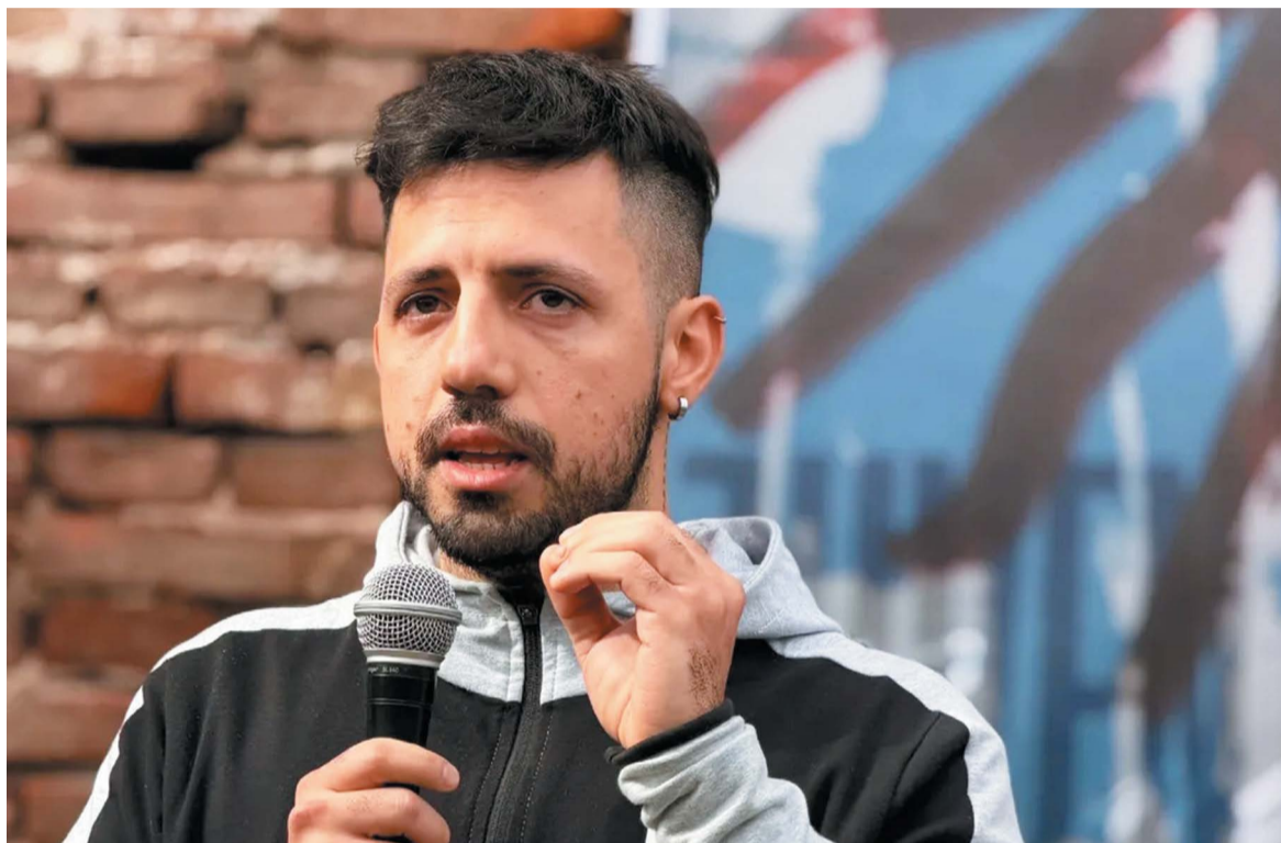
“La juventud no está para ocupar un lugar decorativo”, expresó.

Uno de los puntos centrales expuestos por el referente local se enfocó en la necesidad de transformar las lógicas internas que rigen la actividad partidaria actual, proponiendo avanzar formalmente hacia una concertación que supere las fracturas históricas de las estructuras tradicionales. “Es fundamental para mí este pacto generacional. Entender que la política no va más esa obediencia extrema al dirigente superior o al sello que nos define y eso que nos impida encontrarnos en generaciones o en los territorios, porque algunos adultos tienen saldos pendientes de hace años que no pueden juntarse y eso decanta hacia abajo y nos divide al futuro. Entonces, dejar por ahí esas roscas, esas