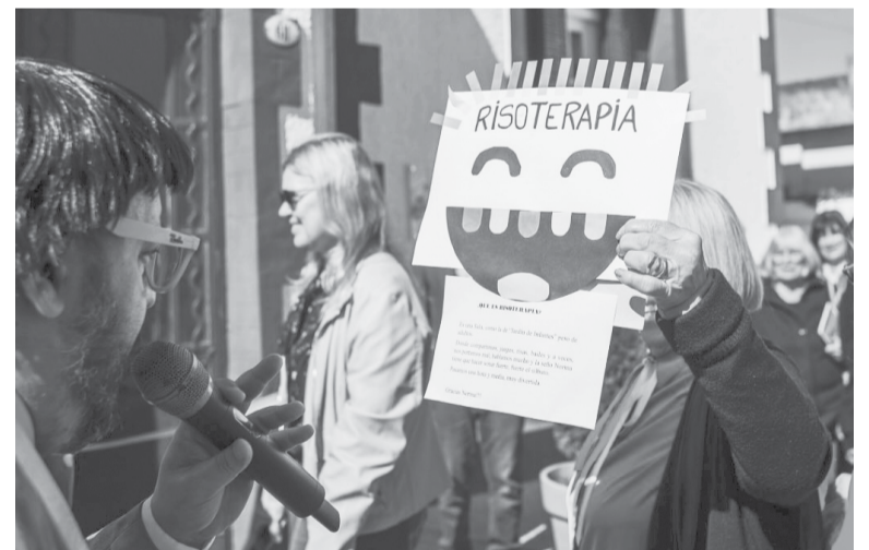
La Casa de la Cultura recibe a grandes y chicos.