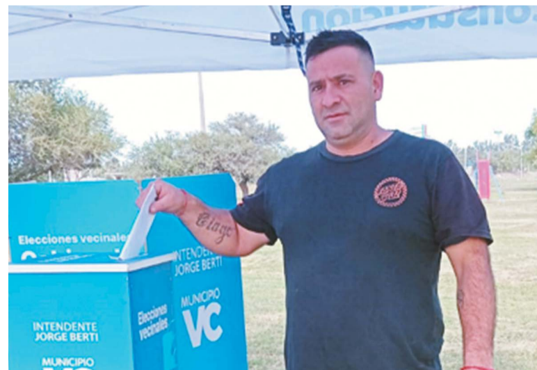
La lista encabezada por Farías recibió 78 votos a favor.

Con el objetivo de dar continuidad a la regularización institucional de las comisiones se extendió una convocatoria abierta para motivar