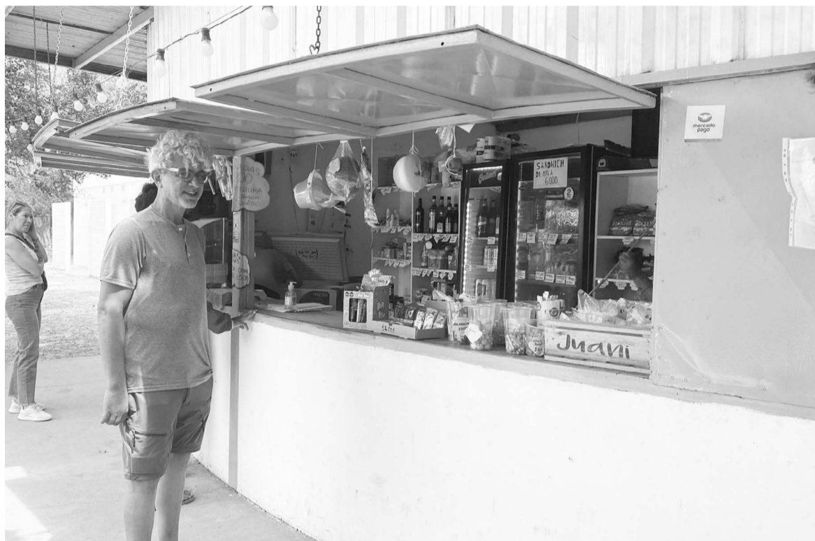
Médula resaltó la excelente temporada estival que tuvieron en el camping.

Actualmente, la cantina abre fuerte los fines de semana, pero el camping recibe gente de lunes