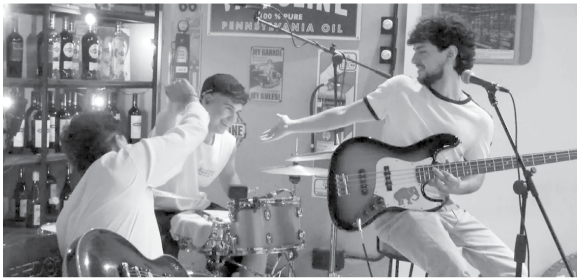
Los músicos prometen una gran velada para este sábado.

Con el objetivo de proponer una experiencia de entretenimiento in-