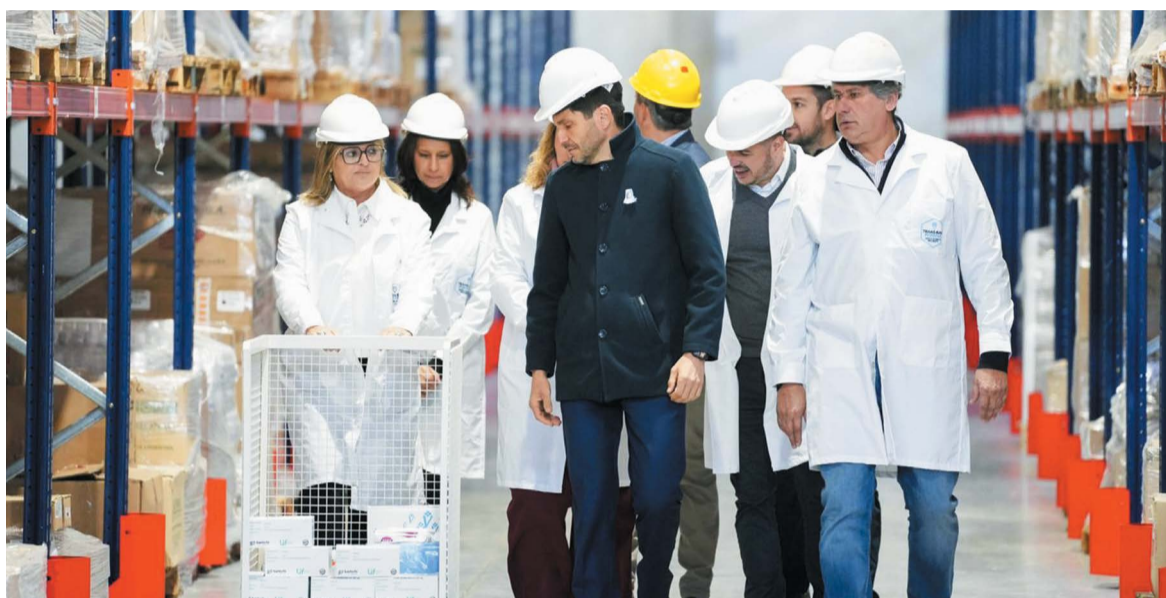
"Mientras sea gobernador, a ningún santafesino le faltará medicamentos", afirmó Pullaro.

"Hay un gobierno austero, honesto y eficiente que piensa y diseña políticas públicas", manifestó el