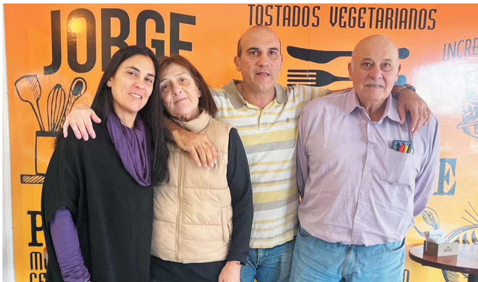
Una gran apuesta familiar que supo ganarse el cariño indiscutido de la comunidad.